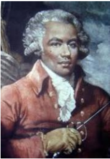
Joseph Boulogne Chevalier de Saint-Georges

indrukwekkende collectie bladmuziek is. Vanwege allerlei mogelijk nakijkwerk en controle heb ik bijna alle orkestsets wel een keer in mijn handen gehad. Dan zie je nog wel eens wat. Je repertoirekennis wordt aardig opgefrist. Ik kan iedere dirigent of repertoire-commissielid aanraden om een dagje vrij te nemen en eens lekker te gaan struinen. Wel even een afspraak maken! Ieder orkest heeft een lijstje, meestal opgesteld door de dirigent of de repertoirecommissie, met daarop werken die ooit nog eens gespeeld gaan worden. Meestal blijven die daarop staan omdat de bezetting te groot is. Het aantal orkesten dat regelmatig Mahler - en Sjostakovitsj-symfonieën of bijvoorbeeld de Enigma Variaties van Elgar kan programmeren is vrij klein. Bovendien is dat een prijzige aangelegenheid en zijn die stukken ook vaak niet bij de FASO te huur, omdat ze nog niet rechtenvrij zijn.