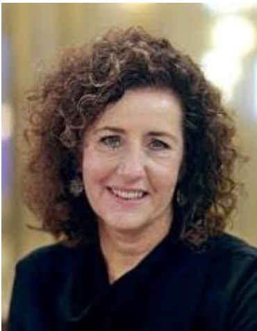
Minister Van Engelshoven